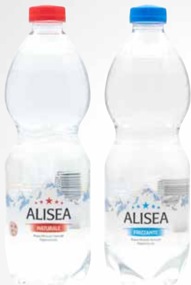
Bottiglia 50 cl. PET