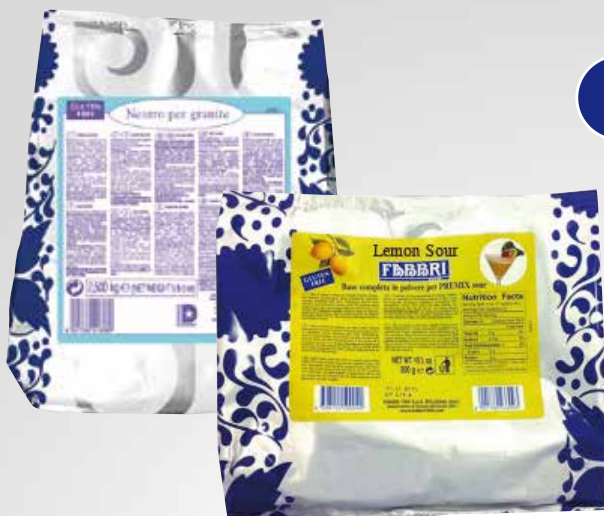
Neutro per granite e Lemon Sour