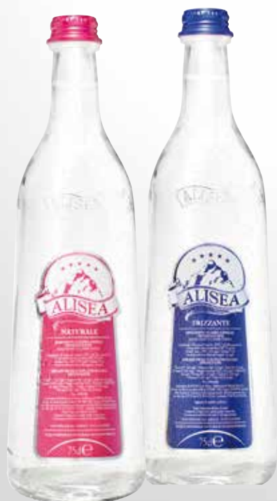
Bottiglia 75 cl.