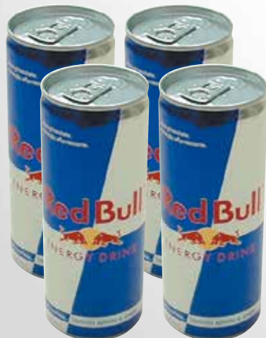
Lattina 25 cl.