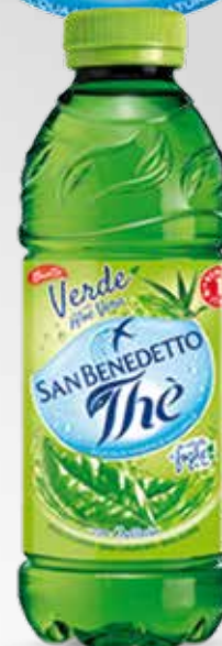
Bottiglia 50 cl.