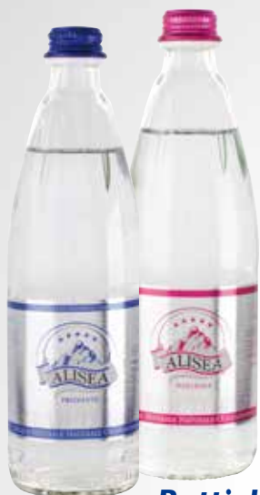
Bottiglia 50 cl.