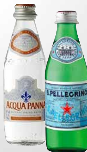
Bottiglia 25 cl.