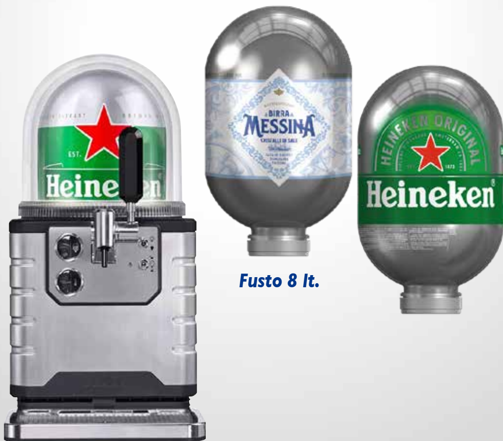
Fusto 8 lt.