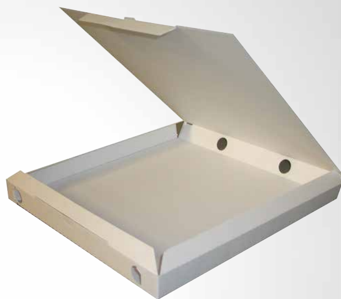
Scatola Pizza 33 cm