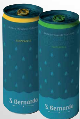
Lattina 33 cl.