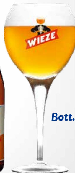
Bott. 33 cl.