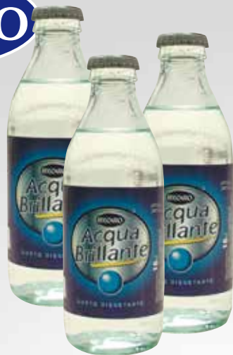
Bottiglia 19 cl.