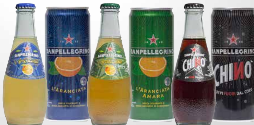
Lattina 33 cl.