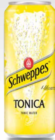
Lattina 33 cl.