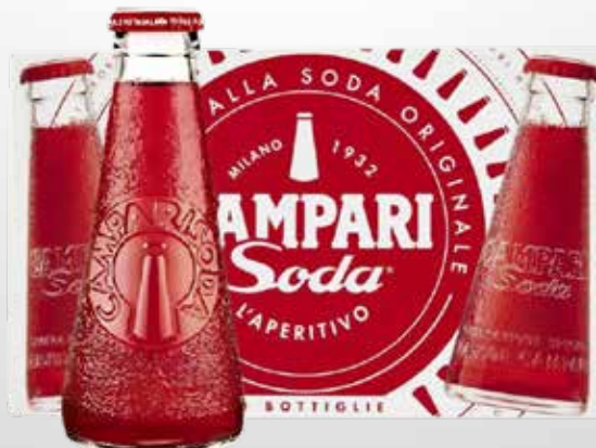
Bottiglia 10 cl.