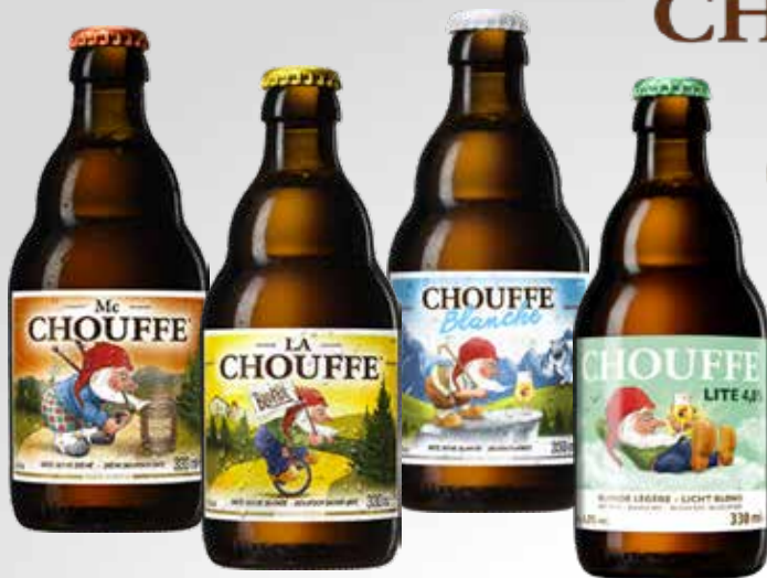
Bott. 33 cl.