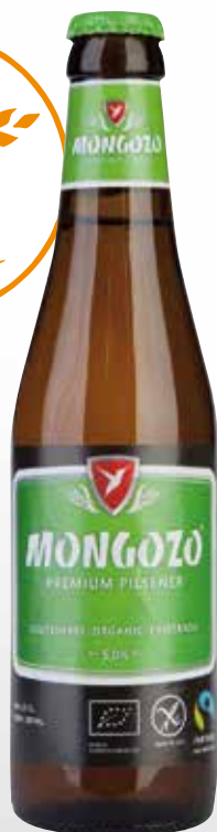
Bott. 33 cl.