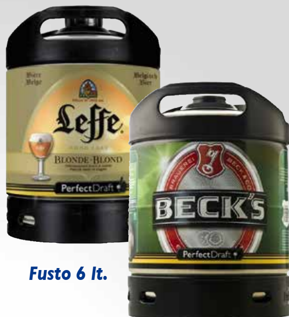
Fusto 6 lt.