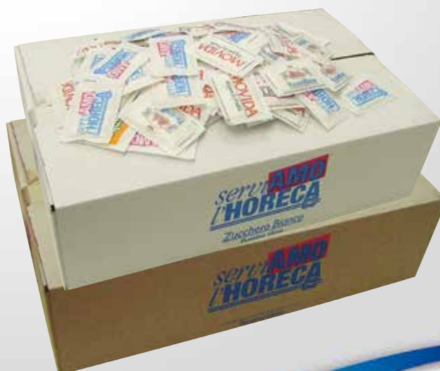
Zucchero Bianco e di Canna