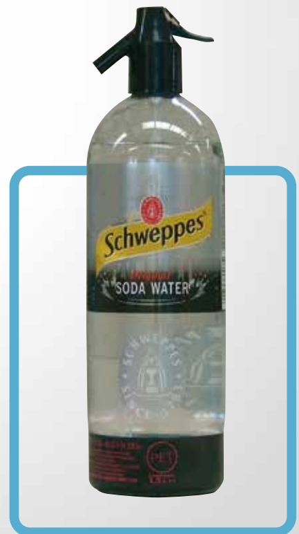
Sifone 150 cl.