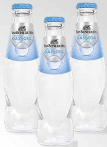
Bottiglia 18 cl.