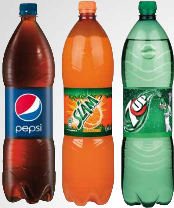
Bottiglia 150 cl.