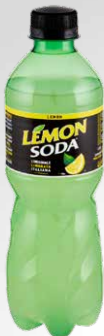
Bottiglia 45 cl.