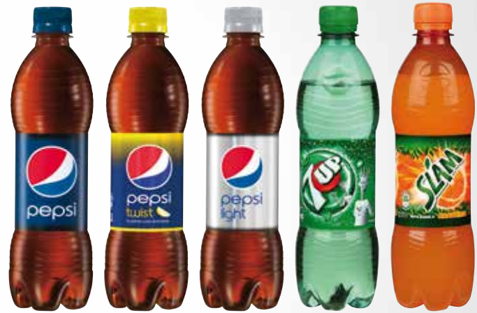
Bottiglia 50 cl. PET