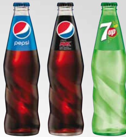
Bottiglia vetro 33 cl.