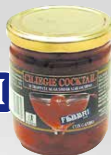
Ciliegie per cocktail