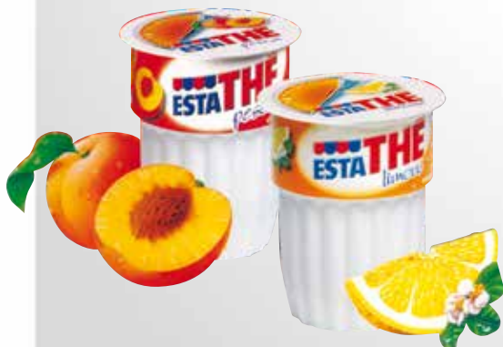
Vasetto 20 cl.