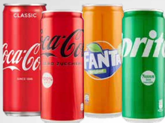
Lattina 33 cl.