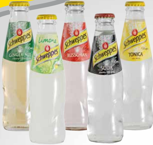
Bottiglia 19 cl.