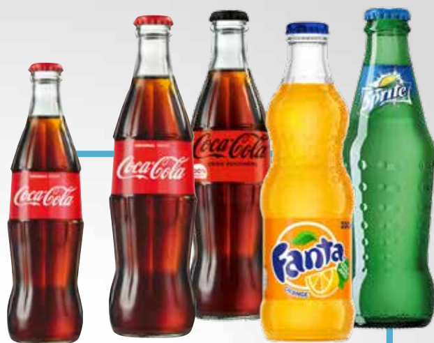
Bottiglia 25 e 33 cl.