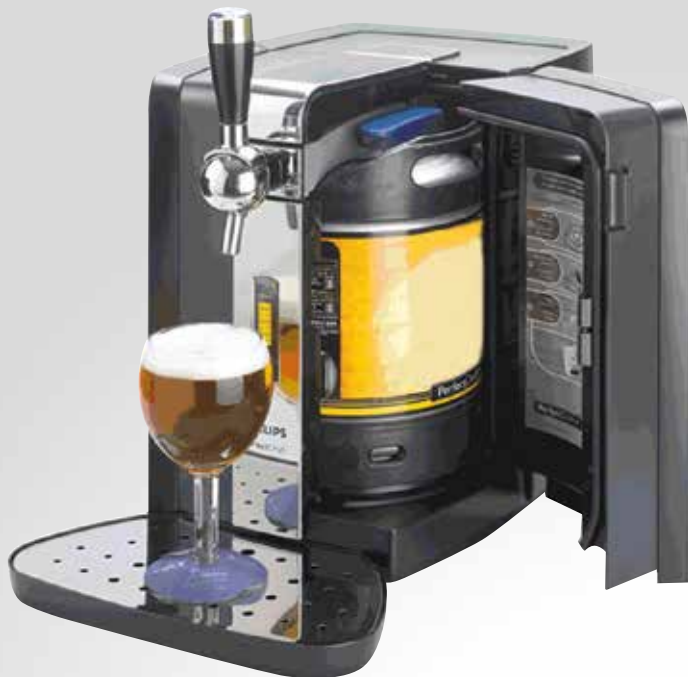
Impiantino Perfect Draft Philips