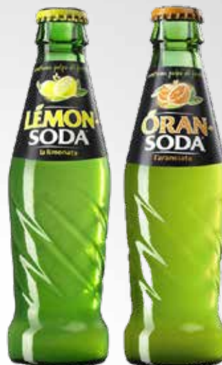
Bottiglia 19 cl.