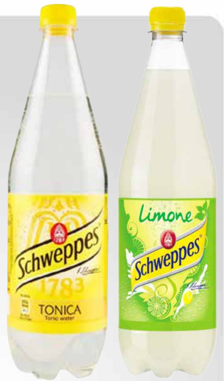
Bottiglia 100 cl.