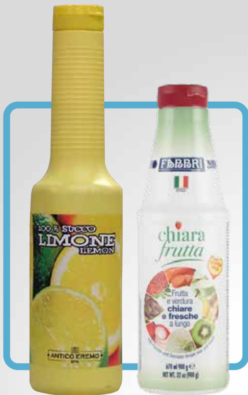
Bottiglia 100 cl. Bottiglia 67 cl.