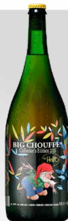
Magnum 1,5 L