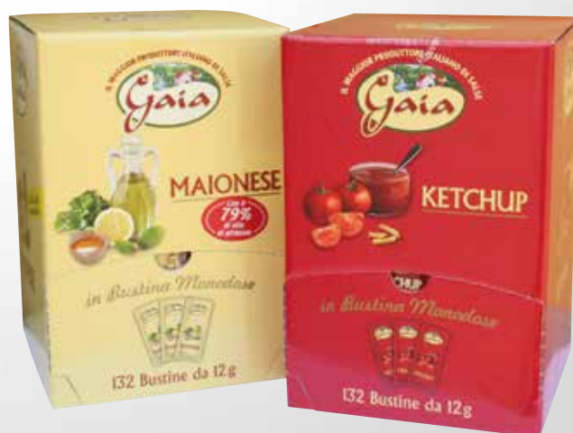
Maionese & Ketchup