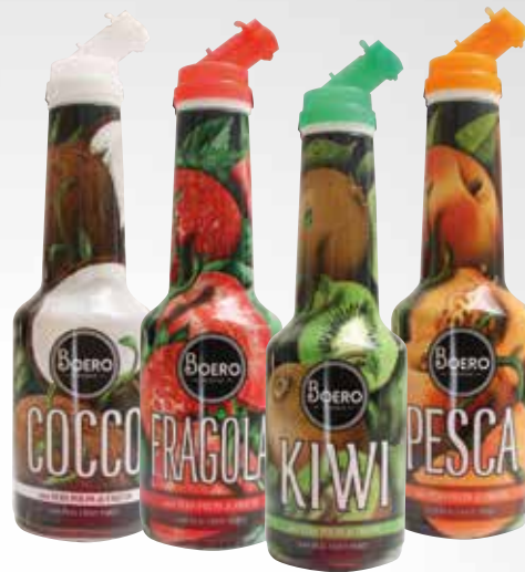
Cocco Fragola Kiwi Pesca Papaya Ananas