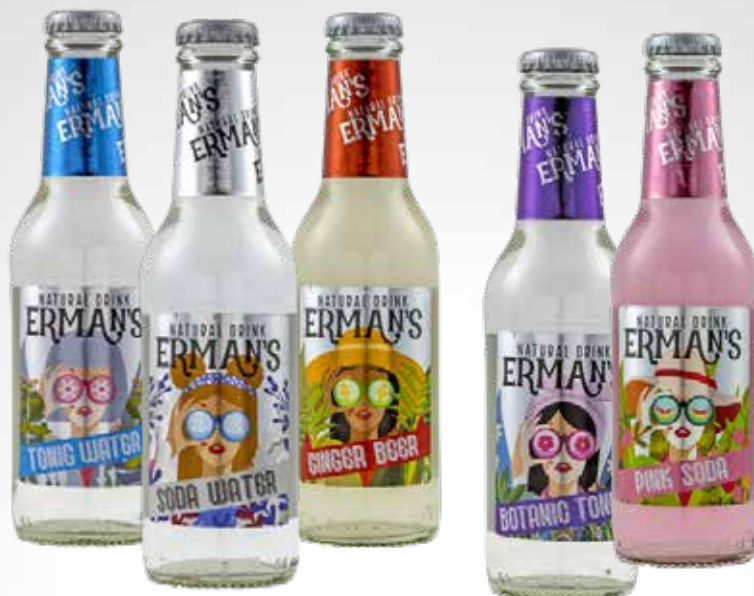
Bottiglia 20 cl.