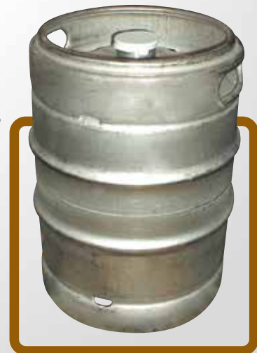
Fusto 25 lt.