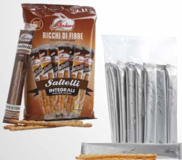
Grissini in confezione singola