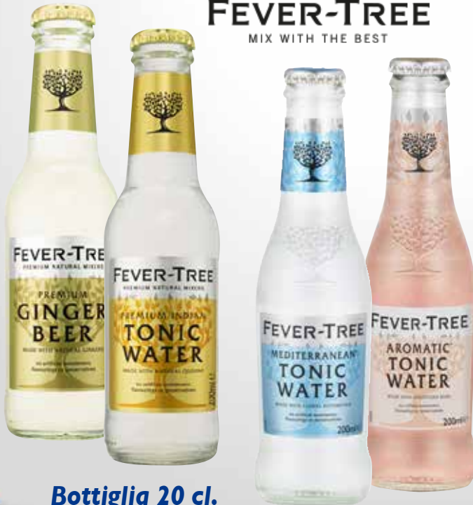
Bottiglia 20 cl.