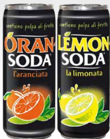
Lattina 33 cl.