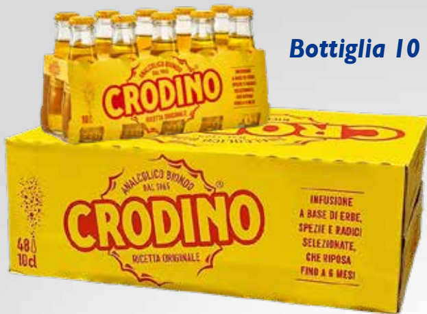
Bottiglia 10 cl.