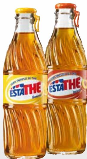
Bottiglia vetro 20 cl.