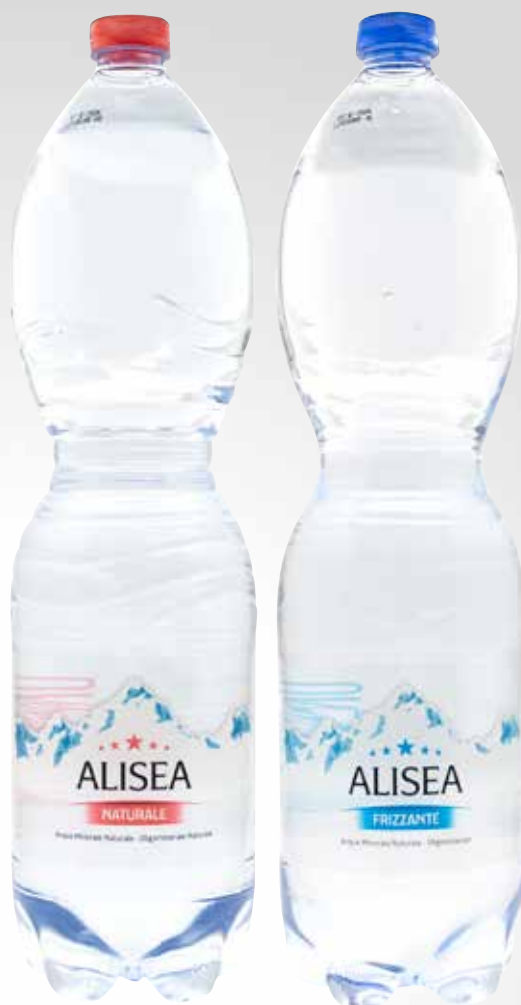
Bottiglia 150 cl. PET