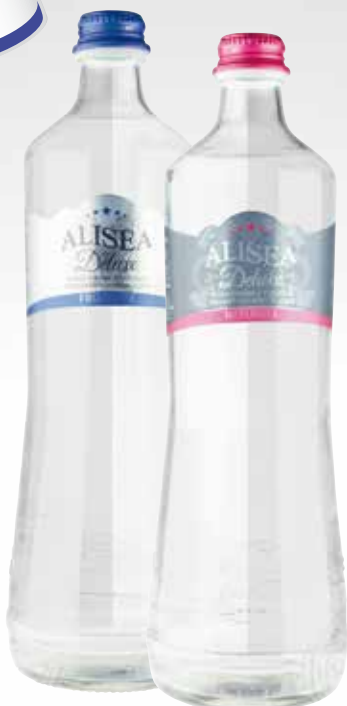
Bottiglia 75 cl.