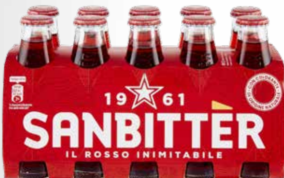
Bottiglia 10 cl.