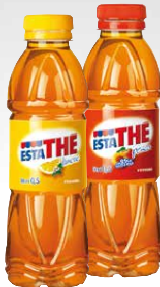
Bottiglia PET 50 cl.