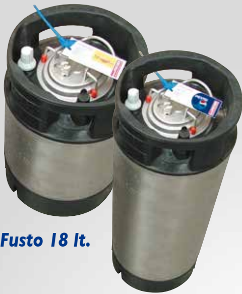
Fusto 18 lt.