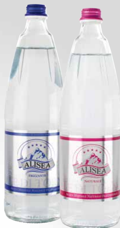
Bottiglia 100 cl.