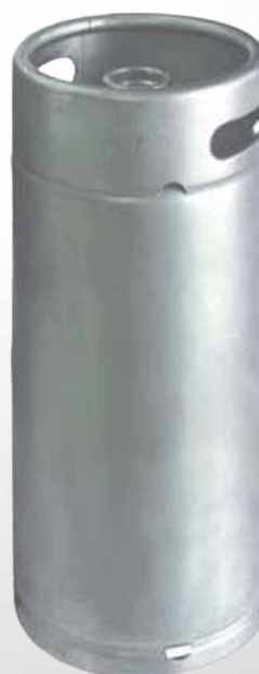
Fusto 20 lt.