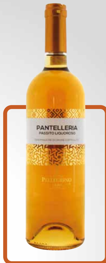
Passito di Pantelleria