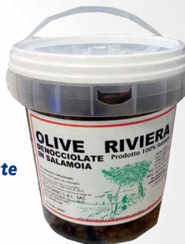
Olive denocciate 5 kg.