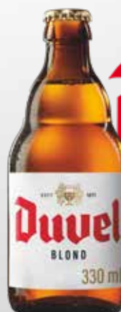
Bott. 33 cl.