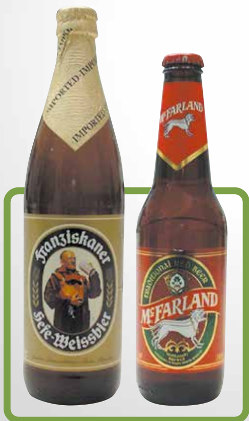
Bott. 50 cl. Bott. 33 cl.