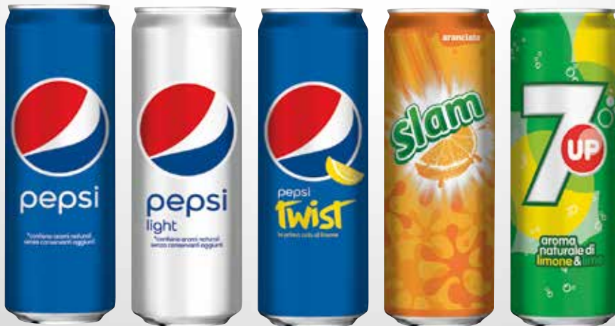
Lattina 33 cl.