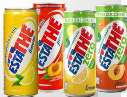
Lattina 33 cl.