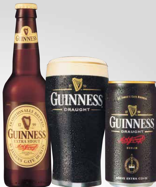
Bott. 33 cl.