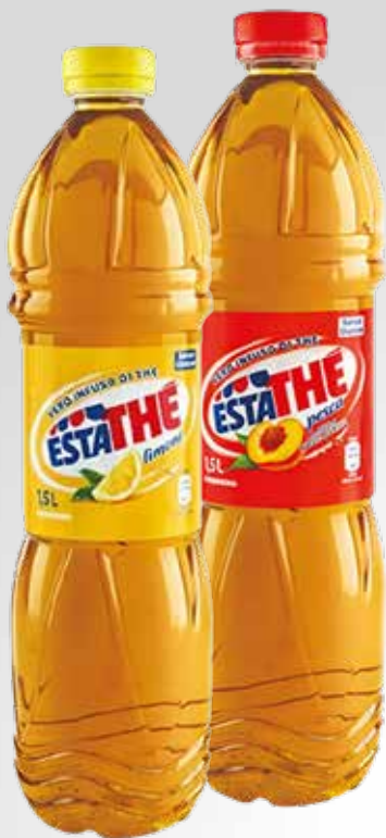
Bottiglia 150 cl.