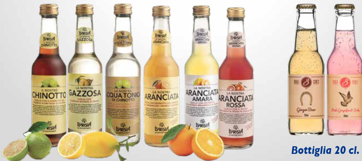
Bottiglia 27,5 cl.